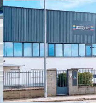
TAMPOPRINT® IBERIA S.A.U. Niederlassung Spanien