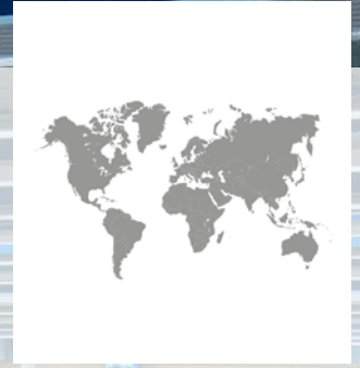
Vertriebsnetzwerk Europa, Amerika, Afrika, Asien, Australien

Die industrielle Produktmarkierung und -kennzeichnung mittels Tampondruck und Laser – das ist unser Metier und unsere Leidenschaft. Für zahlreiche Branchen entwickelt TAMPOPRINT ein perfekt abgestimmtes System aus Maschinen und Verfahren. Unser Ziel: Tampondruck- und Laserverfahren besser und effektiver zu machen.