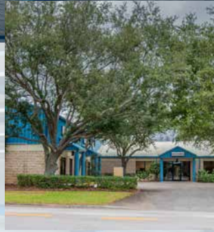
TAMPOPRINT® Int'l. Corp. Niederlassung USA