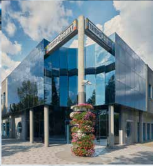
TAMPOPRINT® GmbH Firmenzentrale Deutschland